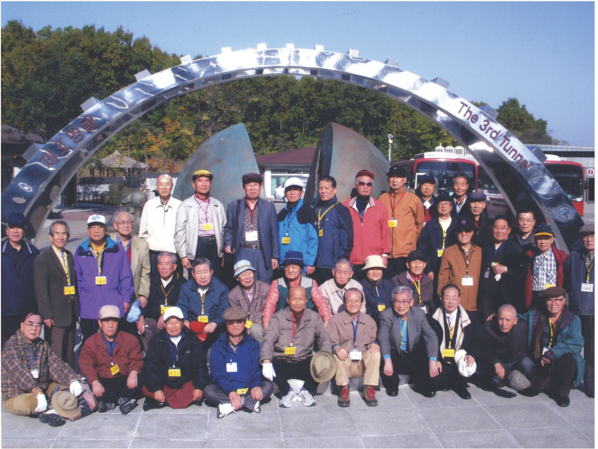
▲ 상록남선교회 가을 야외예배 제 3땅굴 전시관 앞 (2009. 10. 20)