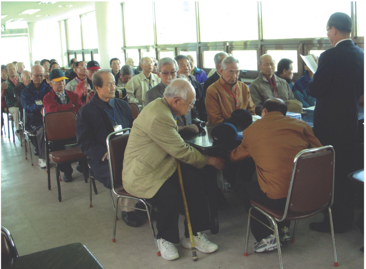
▲ 상록남선교회 가을 야외예배 2009. 10. 20(통일촌 휴게소)