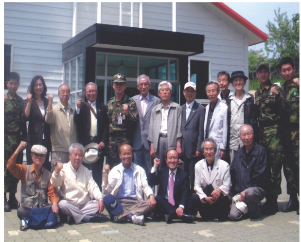
▲ 충성교회 정문 앞에서 (2009. 5. 29)