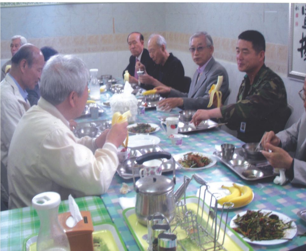
▲ 청호부대내 식당 (2009. 5. 29)